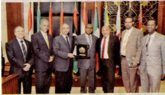
سفير إثيوبيا يتسلم درع الأكاديمية العربية